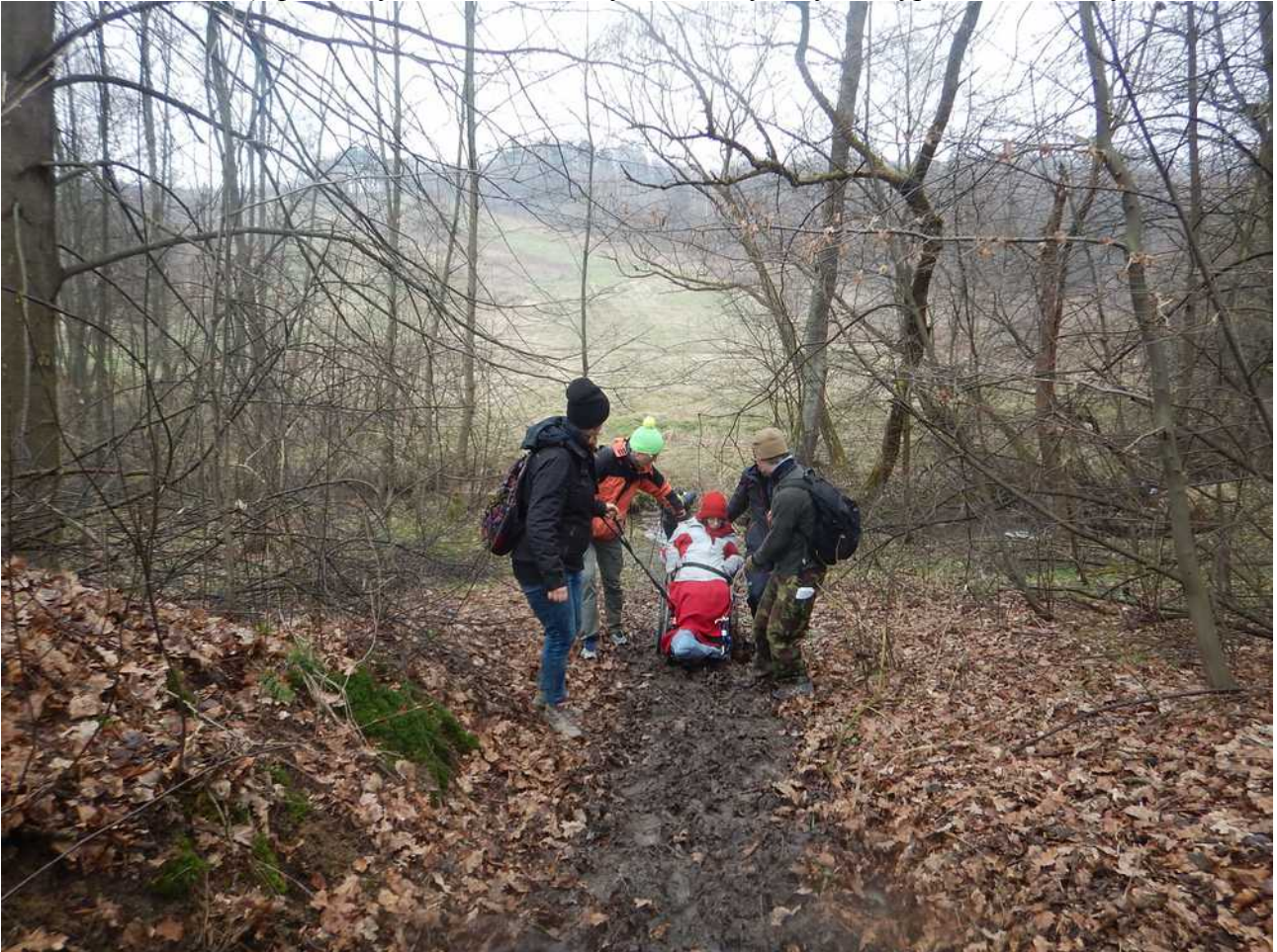
Marzec 2015r. - Ekstremalna Droga Krzyżowa; okolice Kalwarii Zebrzydowskiej

Katolickie Stowarzyszenie Osób Niepełnosprawnych i Ich przyjaciół KLIKA powstało w 1971 roku. Poza działaniami statutowymi, Stowarzyszenie można powiedzieć samorzutnie rozszerzyło swoją działalność o zadania ekstremalne. Począwszy od Ekstremalnej Drogi Krzyżowej organizowanej przez Stowarzyszenie Wiosna (pierwsze i jak na razie jedyne przejście z osobą na wózku inwalidzkim), przez wycieczki w Beskidy, a skończywszy na wyprawach w Tatry.