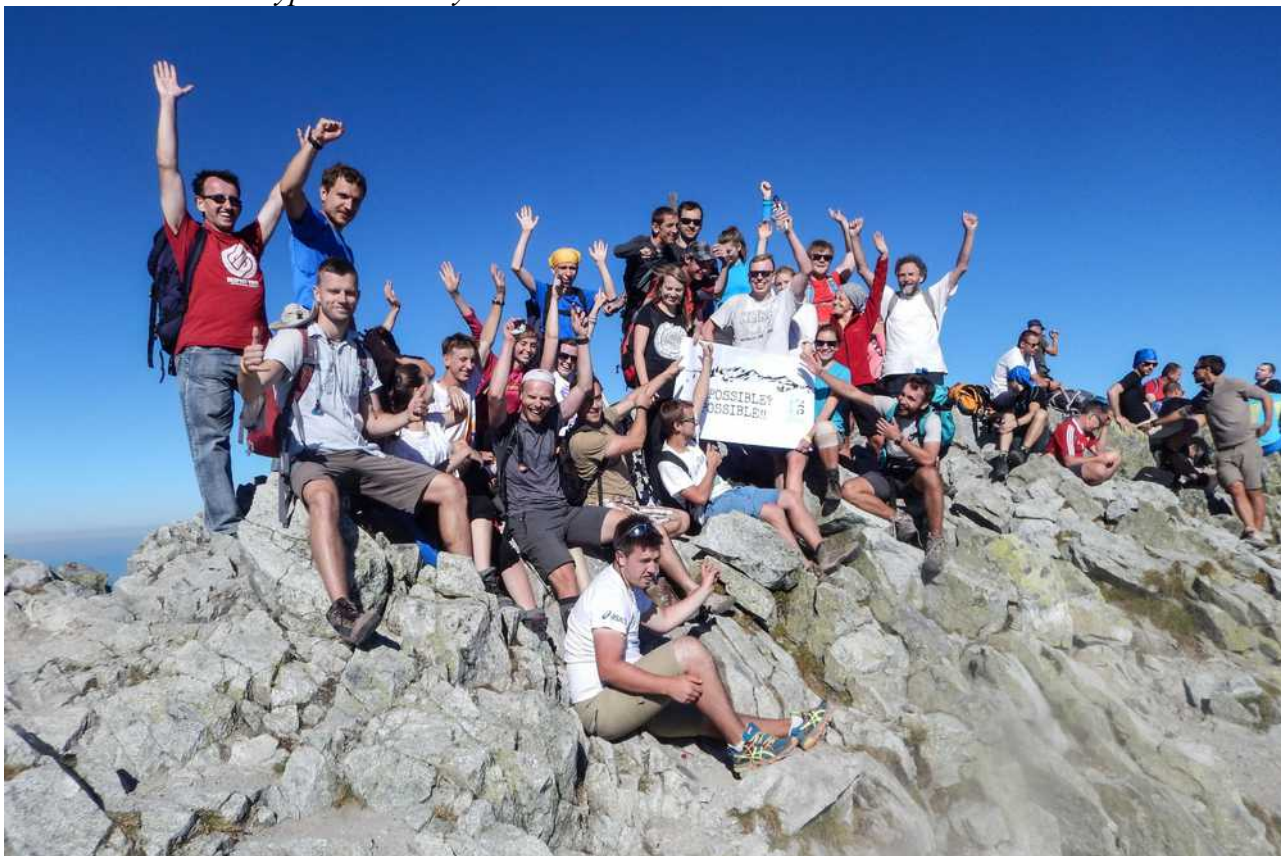
Zdjęcie ze szczytu Krywania.

Odpoczynek nad Hińczowymi Stawami Rok 2016 to udana wyprawa na Krywań.