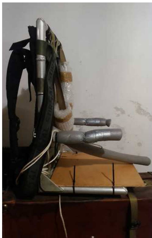
Nosidelko użyte podczas wyprawy na Krywań.