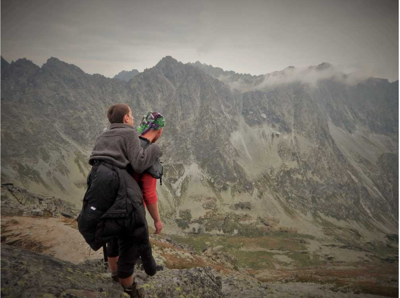
Okolice szczytu Kopyrowego Wierchu

W 2015 roku zorganizowaliśmy wyjście na Kopyrowy Wierch. Ze względu na brak doświadczenia i nie dopracowane nosidełko musieliśmy zawrócić ok. 30m przed szczytem.