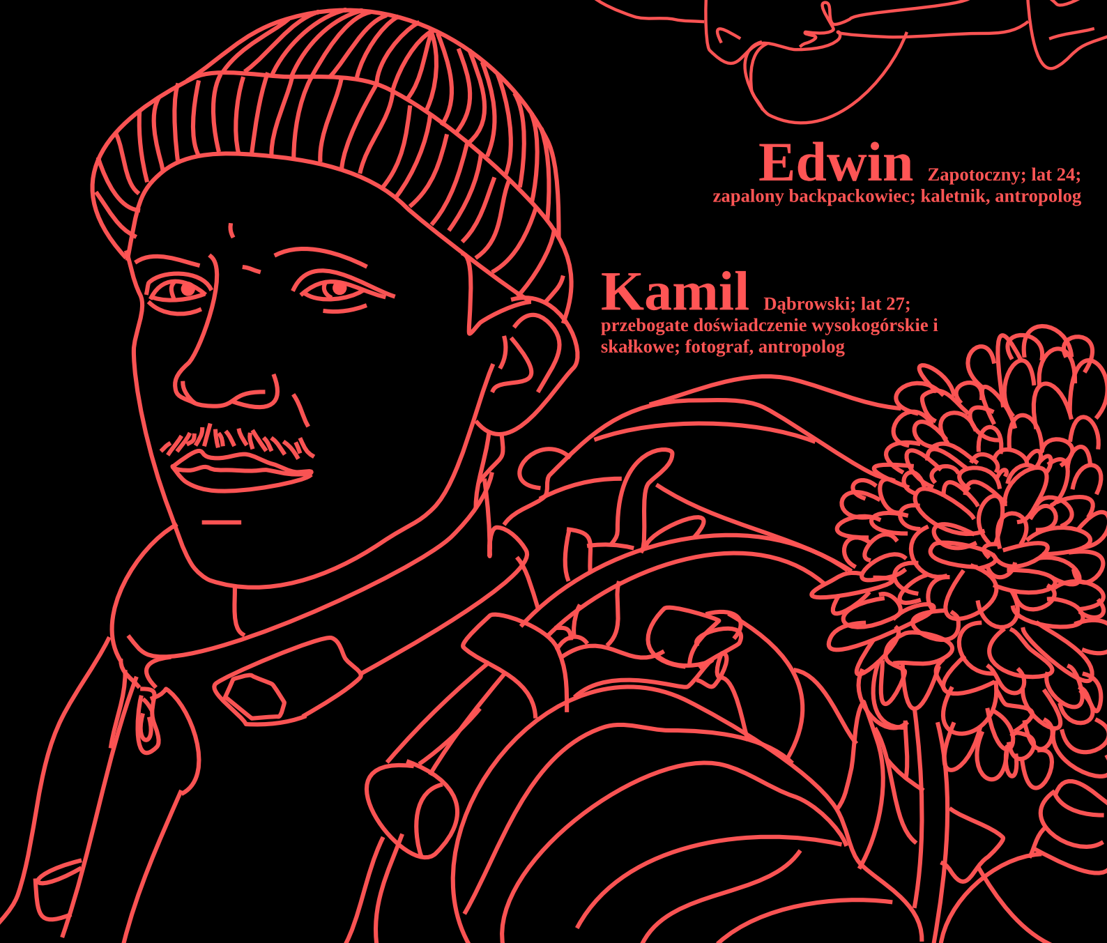
Kamil Dąbrowski; lat 27; przebogate doświadczenie wysokogórskie i skałkowe; fotograf, antropolog