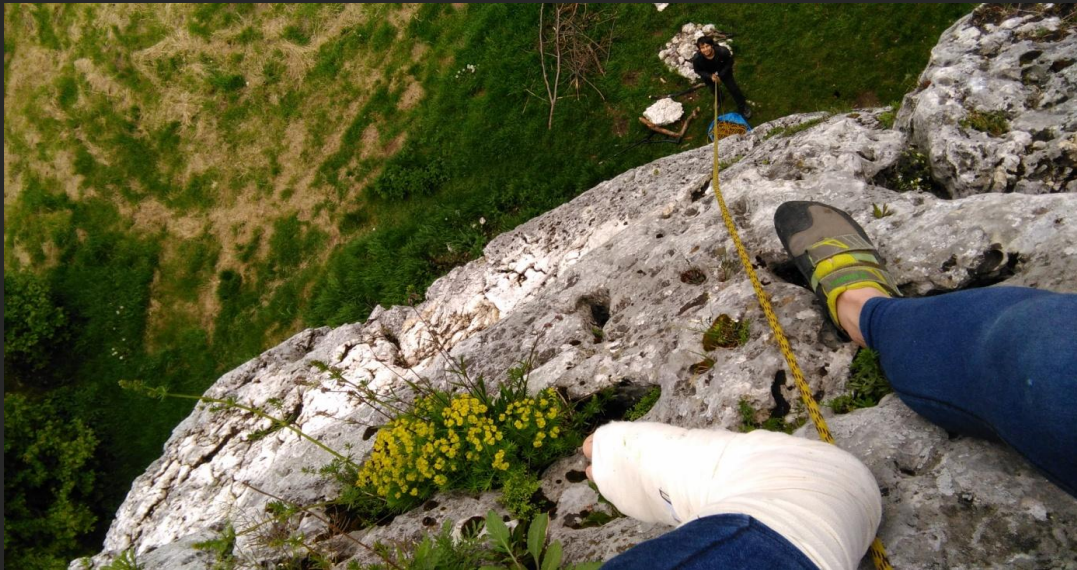
Nie boimy się nietypowych wyzwań!

Jesteśmy zapałonymi pasjonatami gór wysokich i wspinaczki skałkowej, dzięki której możemy stopniowo poszerzać również działalność wysokogórską. Staramy się działać wielowymiarowo i wyjść poza schemat wyobrażeń typowej ścieżki rozwoju umiejętności. Realizując nasz projekt chcemy pokazać, że wspinanie na każdym poziomie zaawansowania, nawet średniozaawansowanym – wiąże się z ogromną ilością możliwości, większą, niż utarło się w ogólnym wyobrażeniu. Kontakt ze skałą to pasja, którą można i należy się bawić, odkrywając jej najciekawsze wymiary. Co więc chcemy zrobić? Przeżyć niepowtarzalną przygodę, wspiąć się w najbardziej nietypowych miejscach w Europie, połączyć doznania towarzyszące różnym rodzajom wspinaczki, sięgnąć poza nasz horyzont, przekazać innym nasze doświadczenia.