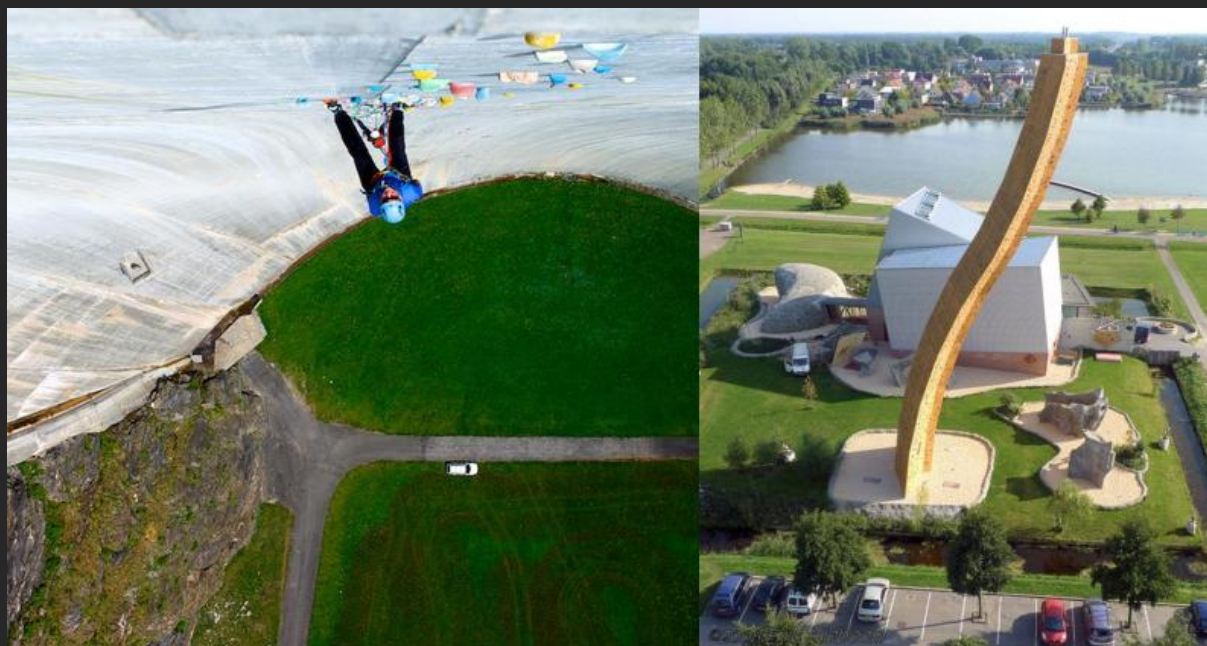
Fot. Od lewej: www.turystyka.wp.pl , Diga di Luzzone; Eric Kieboom, Excalibur.

Nasz projekt ma charakter dwufazowy: przygotowania połączonego z działaniem i samego działania. Zanim dotrzemy do bram Chorwacji (DWS), doszlifujemy psychę i umiejętności w najciekawszych, nietypowych miejscach. Wszystkie cele projektu są dobrane adekwatnie do naszych warunków fizycznych i obecnego poziomu umiejętności wspinaczkowych. Do uroków Deep Water Solo przygotujemy się m.in. na najwyższych ściankach wspinaczkowych na świecie. Po kolei: Excalibur, Bjoeks Clim Center w Holandii; Wunderland Kalkar w Niemczech , gdzie udostępniono sztuczną drogę wspinaczkową na dawnej wieży chłodniczej starej elektrowni jądrowej. Następny cel: najwyższa na świecie sztuczna „ściana” wspinaczkowa (165 m) tama Diga di Luzzone w Szwajcarii . Pogodzeni z wysokością skierujemy się do Słowenii, żeby przed DWS oswoić się ze skokami do wody – canyoning w Bovec (pokonywanie rzek i kanionów z pomocą technik linowych). Wracając do tematu wysokości, nie może ominąć nas jeden z cudów przyrody, wyrastający z dna Równiny Tesalskiej w Grecji kamienny las ponad 1000 niezwykłych skał, Meteorów , osiagających nawet 400 m wysokości od podstawy. Powspinamy się, jednocześnie prowadząc trening psychiczny i fizyczny. Kontakt z geologicznym fenomenem naszej planety ostatecznie przygotowuje nas do tego, żeby porzucić linę i oddać się „najczystsшему” kontaktowi ze skałą, wspinaczce solowej Psicobloc .