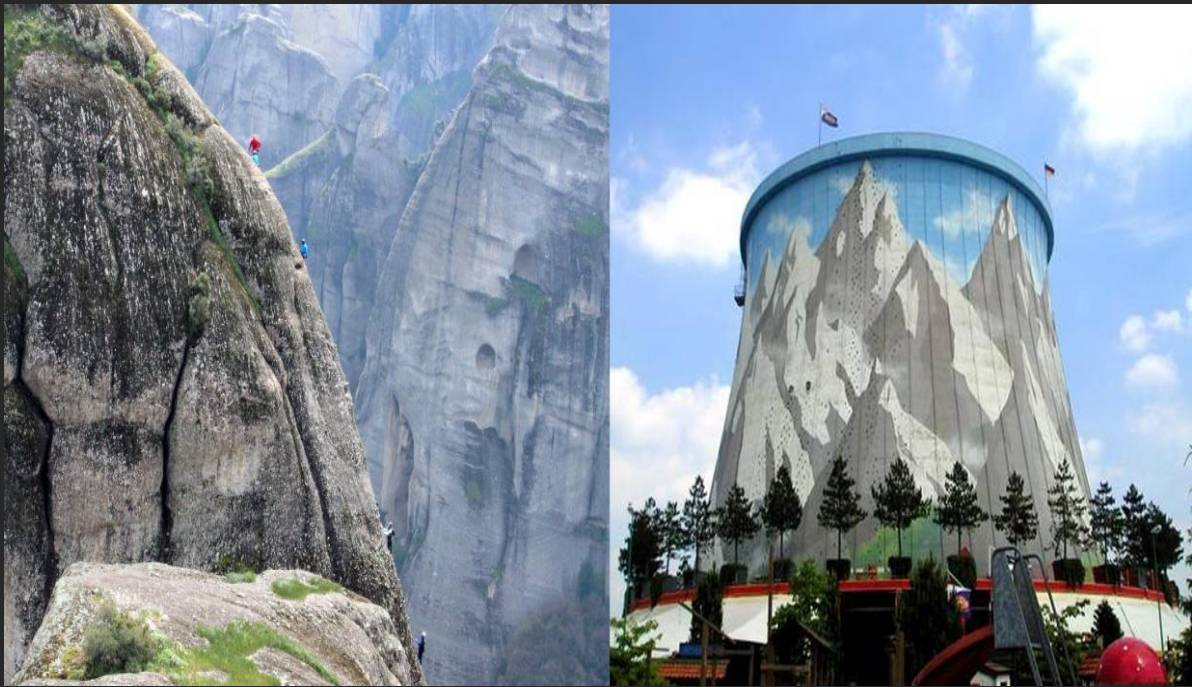
Meteory, Grecja; Wunderland Kalkar.